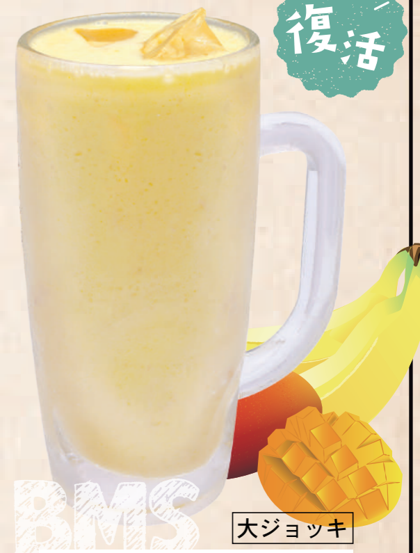
復活 大ジョッキ バナナマンゴースムージー 620円(税込)