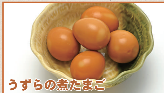
うずらの煮たまご