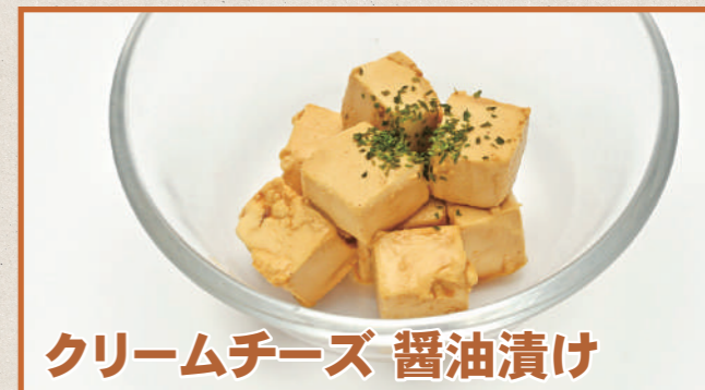
クリームチーズ 醤油漬け