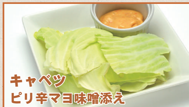
キャベツ ピリ辛マヨ味噌添え