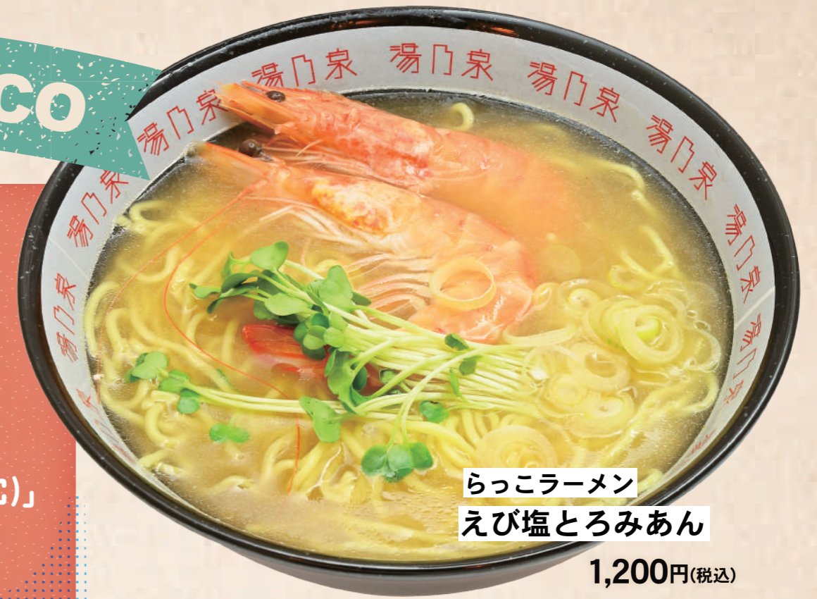
らっこラーメン えび塩とろみあん 1,200円(税込)