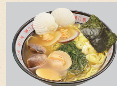
らっこラーメン はまぐり塩ほたて味

このプロジェクトの第一弾として、ラッコの未来を支援するために「らっこラーメン」をらっこ食堂のメニューにて提供いたします