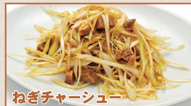
ねぎチャーシュー