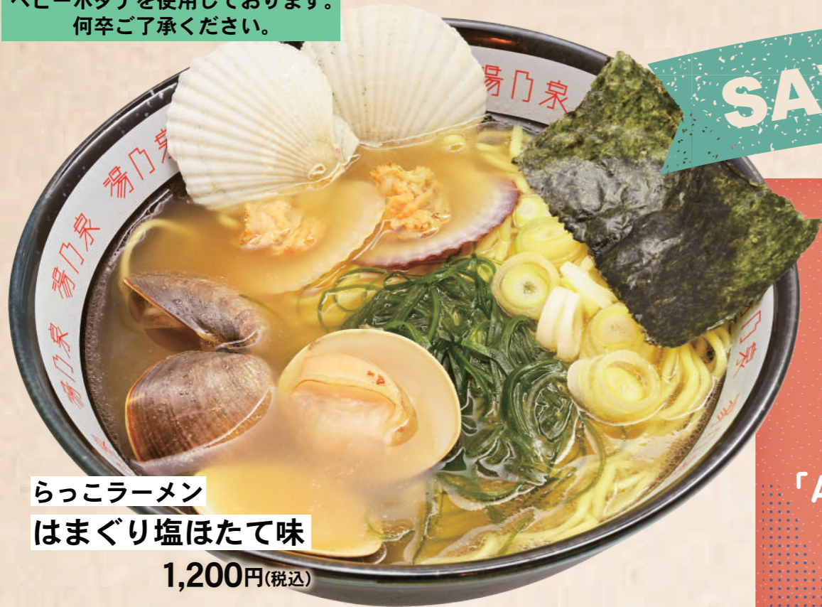
らっこラーメン はまぐり塩ほたて味 1,200円(税込)