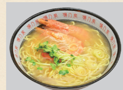
らっこラーメン えび塩とろみ

この一杯をご注文いただくと、「らっこラーメン」の売上の一部を、アラスカでラッコの保護活動を行っている「Alaska SeaLife Center (ASLC)」 https://www.alaskasealife.org/ に寄付いたします。