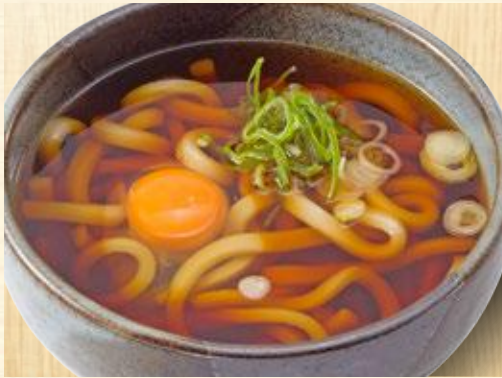
月見うどん・そば