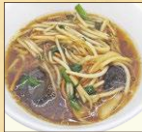
小盛サイズ サンマーメン (もやしあんかけ麺)