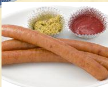
おつまみウイナー 640円