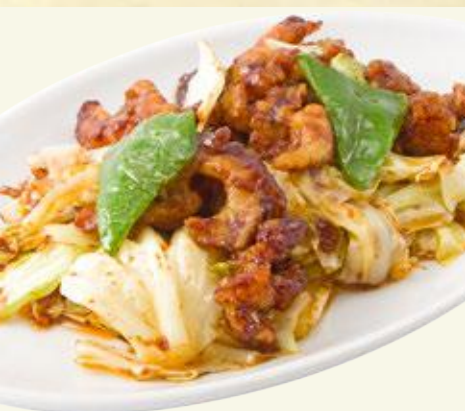
回鍋肉(ホイコーロー) 460円