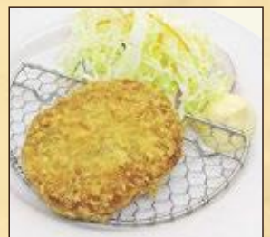
小盛サイズ 手作りコロッケ