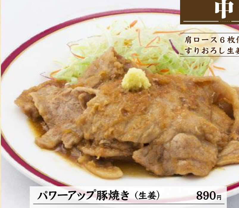
パワーアップ豚焼き (生姜) 890円