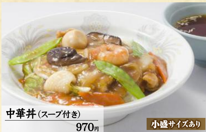
中華丼 (スープ付き)