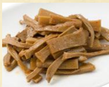
おつまみメンマ 430円