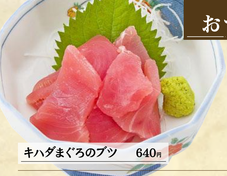
キハダまぐろのブツ 640円