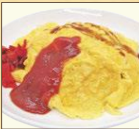
小盛サイズ とろとろ オムライス