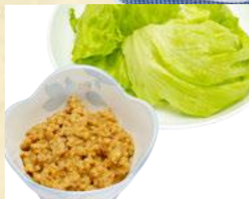
にんにく鶏そぼろ肉味噌 レタス付き 680円