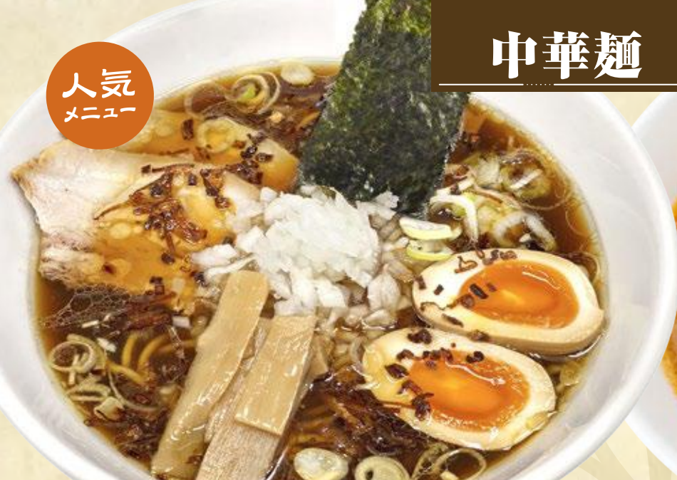
百年醤油特製ラーメン 990円

小豆島で創業100年以上の歴史あるヤマロク醤油の天然醸造醤油を使用。歴史の積み重ねが作り上げる濃厚な旨味とコクをお楽しみください。