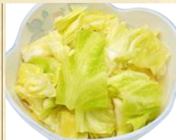
ハルピンキャベツ 530円