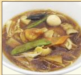
小盛サイズ 広東麺