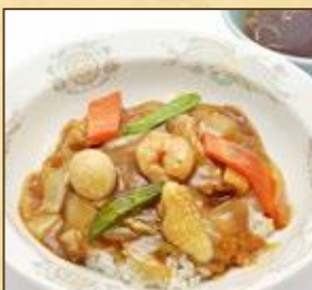
小盛サイズ 中華丼 (スープ付き)