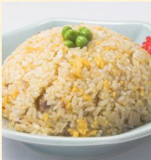
チャーハン(スープ付き)