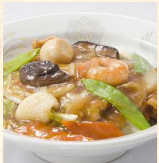
中華丼(スープ付き)