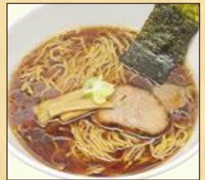
小盛サイズ 醤油ラーメン