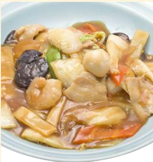
五目あんかけ焼きそば