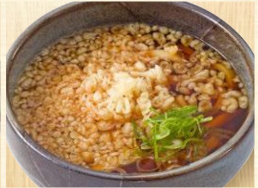
たぬきうどん・そば