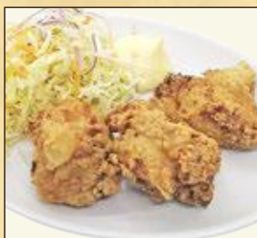
小盛サイズ 若鶏の 漬け込み唐揚げ