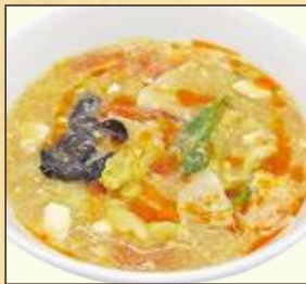
小盛サイズ 蕃茄酸辣湯麺 トマトサンラータンメン