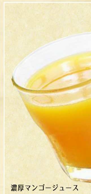
濃厚マンゴージュース