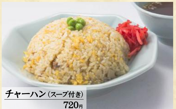
チャーハン (スープ付き)