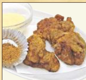
小盛サイズ カレー唐揚げ