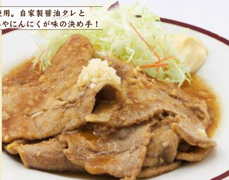
パワーアップ豚焼き (にんにく) 890円