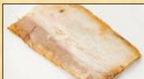
チャーシュー 1枚 120円