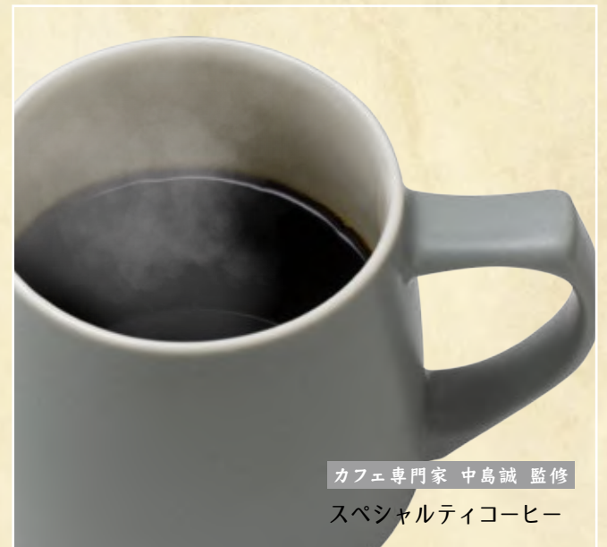
カフェ専門家 中島誠 監修 スペシャルティコーヒー