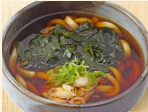
わかめうどん・そば