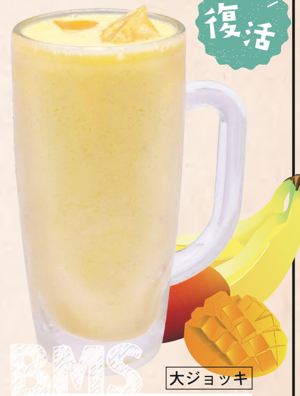
復活 大ジョッキ バナナマンゴースムージー 620円(税込)