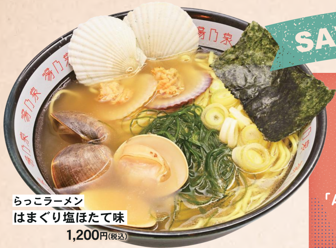
らっこラーメン はまぐり塩ほたて味 1,200円(税込)