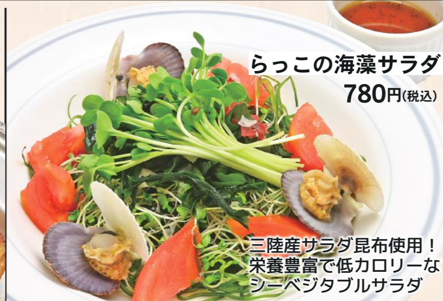
らっこの海藻サラダ 780円(税込)