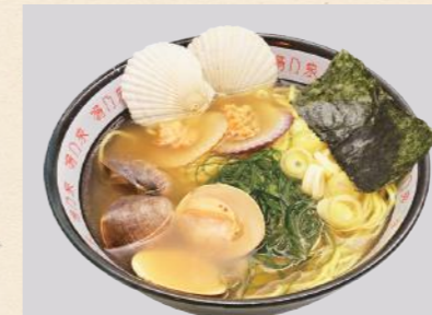
らっこラーメン はまぐり塩ほたて味

このプロジェクトの第一弾として、ラッコの未来を支援するために「らっこラーメン」をらっこ食堂のメニューにて提供いたします