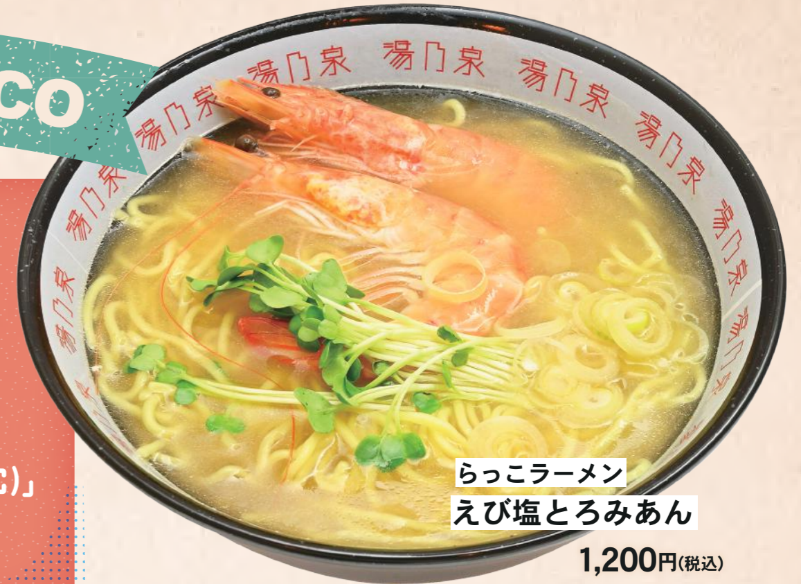
らっこラーメン えび塩とろみあん 1,200円(税込)