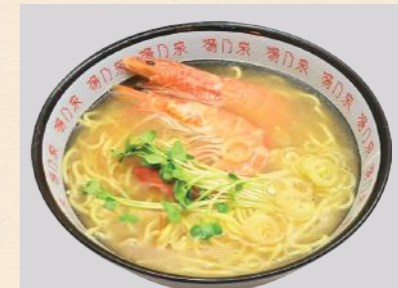
らっこラーメン えび塩とろみ

この一杯をご注文いただくと、「らっこラーメン」の売上の一部を、アラスカでラッコの保護活動を行っている「Alaska SeaLife Center (ASLC)」 https://www.alaskasealife.org/ に寄付いたします。