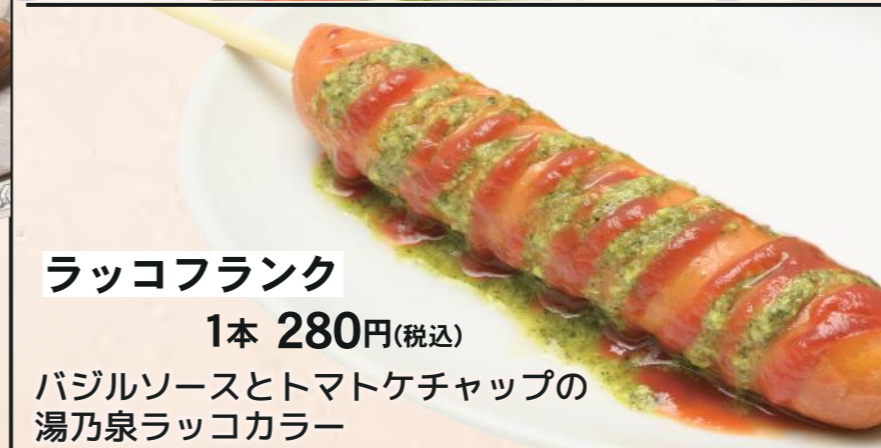
ラッコフランク 1本 280円(税込)